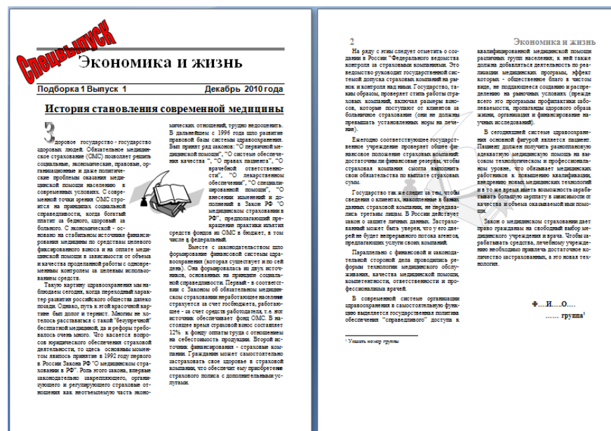
Рис. 3Пример оформления задания

Оформить документ профессиональной направленности в виде журнальной или газетной статьи с созданием колонок, колонтитулов и содержанием графических объектов. Образец оформления представлен в примере рис. 3.